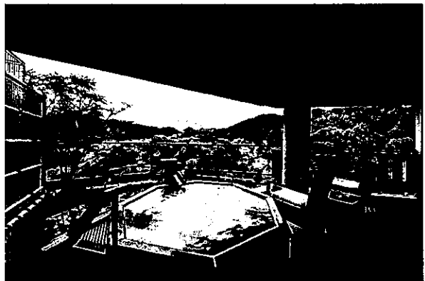
露天風呂付き客室

詳細は大谷山荘公式ホームページをご確認ください。( https://otanisanso.co.jp/ )