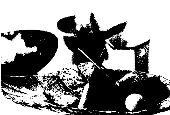
夕食例(季節に合わせた食事を提供)